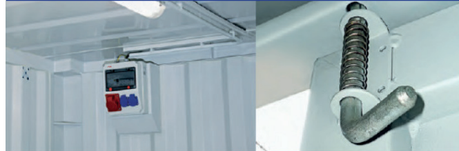
LAMPE NÉON ET TABLEAU DE DISTRIBUTION AVEC PRISES ÉLÉC