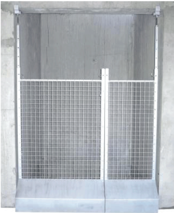
BAIE D'ASCENSEUR FIXE - CÔTÉ À CÔTÉ